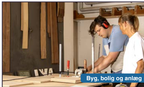
Byg, bolig og anlæg

I samarbejde med den kommunale Ungeindsats finder du en elevplads og sammen med virksomheden indgår I en kontrakt, der typisk varer 2 år. Din uddannelse starter op, når kontrakten er underskrevet og startdatoen er aftalt. Der er mulighed for at starte hele året.