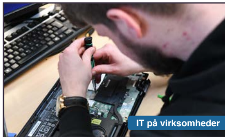
IT på virksomheder